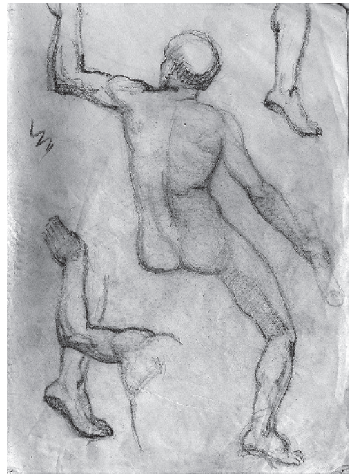
Fig. 3. – Anatomie pour Constantin. Étude pour l'église du Saint-Esprit, v. 1932, graphite sur papier, 32 × 24 cm, carnet VI, inv. 619.39.

par de nombreuses recherches sur le costume paléochrétien [Fig. 2], puis par des études anatomiques pour chaque figure [Fig. 3], avant la stylisation définitive sur le mur. Cela assure à Henri de Maistre une composition lisible, dont la rigueur provient avant tout de la fermeté des tracés se détachant sur le fond rouge unitaire.