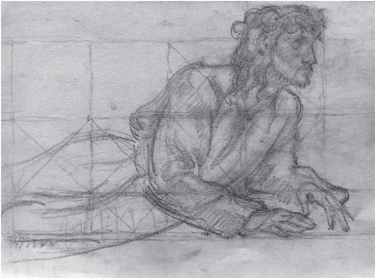
Fig. 4. – Étude pour le Christ du chemin de croix de Saint-Michel de Picpus , 1934, graphite sur papier, 32 × 24 cm, carnet II, inv. 615.10.

et transposée dans la douloureuse tendresse des figures enlacées du prêtre et du Christ [Fig. 1]. Elle est aussi lisible dans les diverses études pour le décor de la chapelle du collège parisien Saint-Michel de Picpus en 1934 [Fig. 4]. Des figures habitées par une joie profonde peuplent les esquisses pour les vitraux de cet ensemble. Henri de Maistre réunit ainsi l'esprit des deux maîtres : le lyrisme de Desvallières et la douce sérénité de Denis.